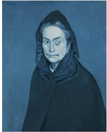
La Celestina de Pablo Picasso (1904), Musée National Picasso, París. Aparece retratada una alcahueta ciega de un ojo convertida en el símbolo de la España libertina.

De origen hispanoárabe, la palabra alcahueta define a una mujer, generalmente anciana y astuta, que se dedica a ayudar a los amantes a llevar una relación amorosa encubierta .