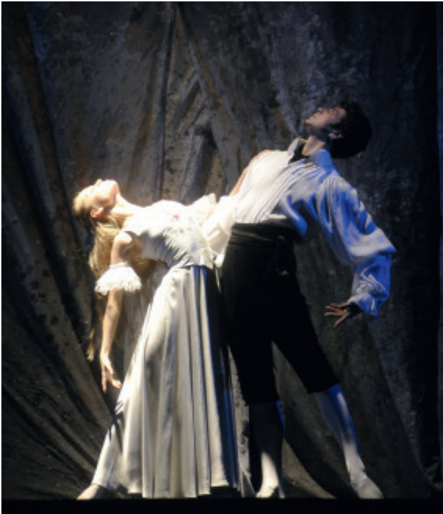
El ballet basado en la comedia de Lope de Vega El maestro de danzar .

Juana la Loca , de Vicente Aranda (2001), nos muestra la vida de Juana, hija de los reyes Católicos y heredera al trono, que enloquece de amor.