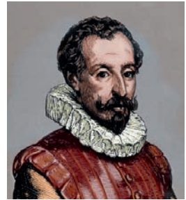
Miguel de Cervantes.

En el campo literario destacan Miguel de Cervantes, autor de la novela El ingenioso hidalgo Don Quijote de la Mancha , Lope de Vega y Calderón de la Barca, que escriben obras de teatro. El teatro es el género más importante de la época. Deja de ser itinerante, las obras se representan en los interiores de bloques de casas de vecinos y hay que pagar una entrada. Estos lugares se llaman corrales de comedias . Hoy en día solo se conserva uno íntegramente: el corral de Almagro. Allí se celebra el Festival Nacional de Teatro Clásico, donde se representan obras a la manera del Siglo de Oro.